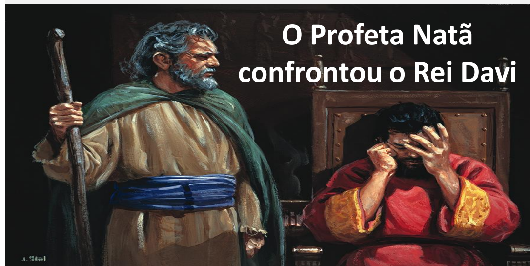
O Profeta Natã confrontou o Rei Davi

SER CHEIO DO ESPIRITO SANTO É IMPRESCINDÍVEL PARA QUEM DEUS CHAMA COM O MINISTERIO DE PROFETA; O PODER DE DEUS EM NOSSA VIDA É QUE NOS ENCHE DE CORAGEM PARA CONFRONTAR O PECADO QUE CONTAMINA ESTE MUNDO